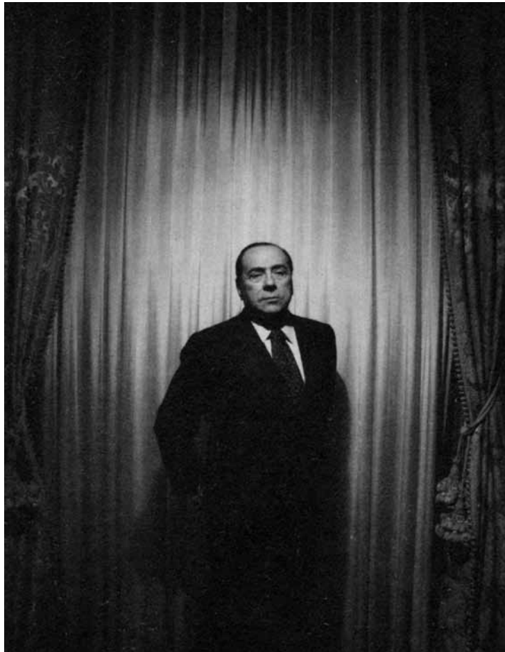
Alex Majoli, Roma, 2008

scambiano oramai tra loro senza più scambiarsi con qualcosa di reale». Di più: la simulazione dello scambio dei segni ha finito per sterminare ogni referenza reale. La vicenda di Silvio Berlusconi, lo sviluppo e il trionfo della sua televisione fondata sulla pubblicità – sulla vendita della pubblicità e sulla pubblicità come contenuto stesso di questa vendita – va letta all'interno di questo quadro.