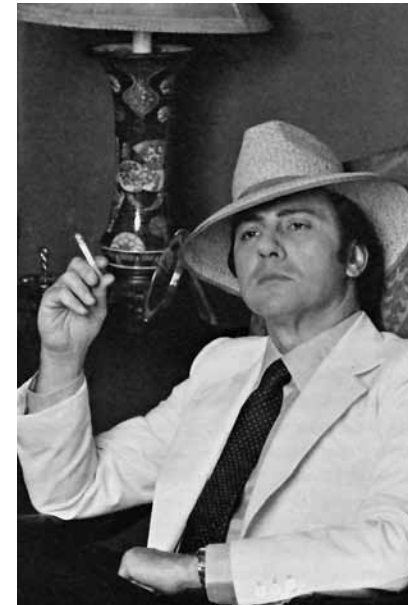
Evaristo Fusar, Silvio Berlusconi, 1980

Paperback: 160 Pages Language: Italian Publisher: Ugo Guanda Editore, 2009