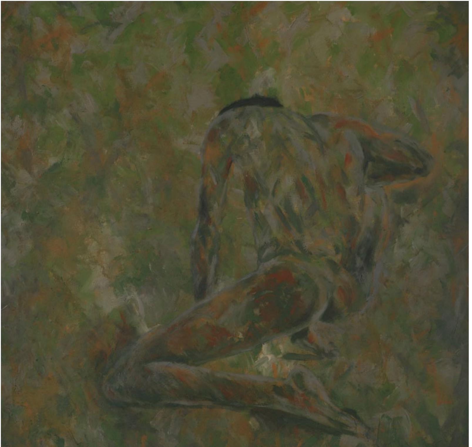
FABIO AMAYA DISTANCIA, 1999 TECNICA MISTA S/LINO 198 x 198 cm