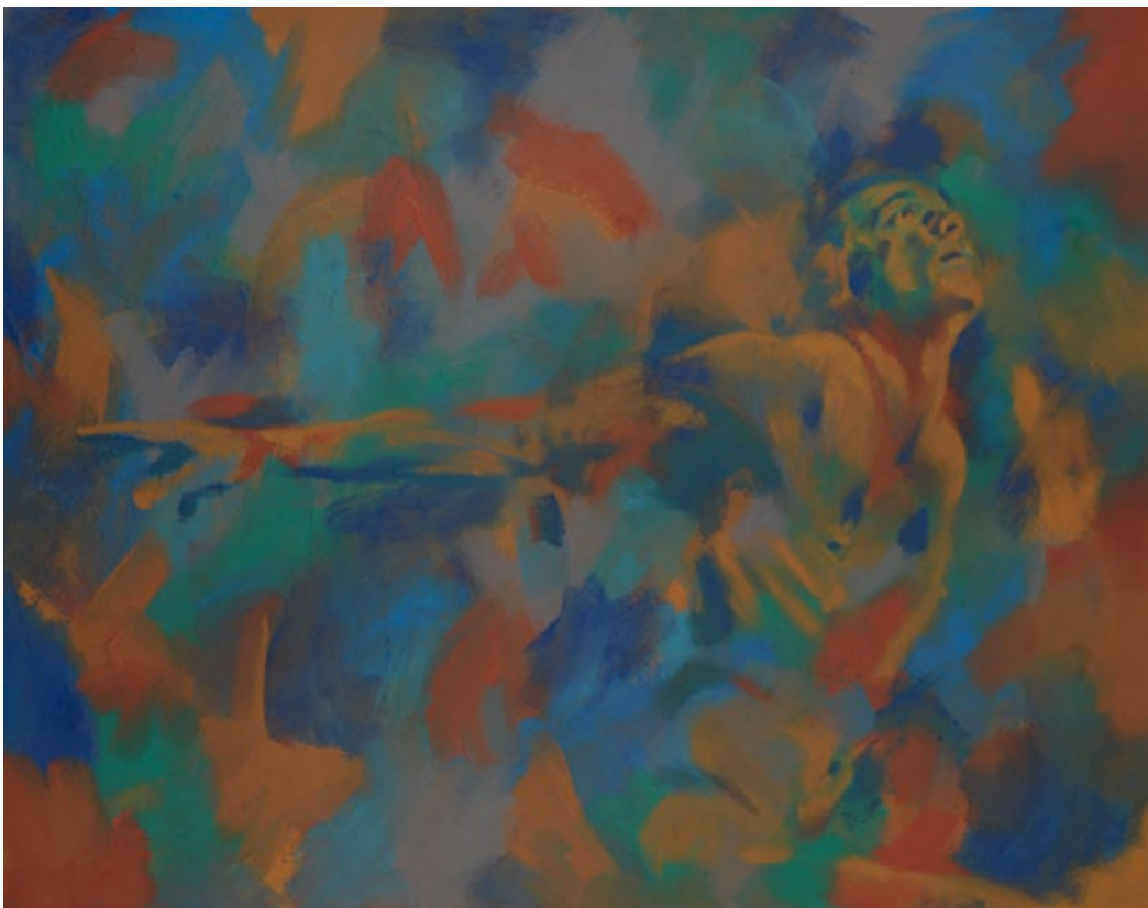
FABIO AMAYA PROMETEO ANTE EL FUEGO, 2006 TECNICA MISTA S/LINO 160 x 120 cm